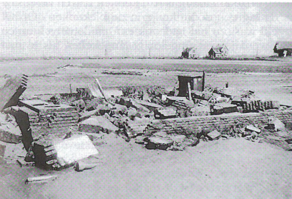
Van een woning aan het Hennikenspad waren regenbak en schoorsteenmantel rampbestendig.

Daar had men vanuit het zolderraam naar de leilinden die er voor stonden een plank gelegd en in die bomen een matras gelegd. Het kon een vluchtroute zijn. Van de meeste woningen in de polder was alleen wat puin over. Van het huis van