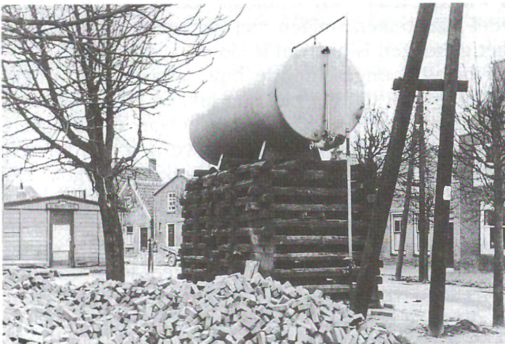
Drinkwater werd over water aangevoerd. De tank werd in de Ring geplaatst. (Coll. Oud Ouwerkerk In Documenten).

Een taxi bracht ons naar 'd'n Stêenen Diek' vanwaar de bootjes vertrokken die de veerdiensten over de Vierbannenzee onderhielden, tenminste zolang de vloed dat toeliet. De wind was toegenomen voor we vertrokken, dus buiswater genoeg. Je sperde je ogen open om overgebleven vaste punten te ontdekken. In de verte twee eilandjes, Nieuwerkerk en Ouwerkerk, de cichoreifabriek van Capelle, de molen bij Ouwerkerk, waren herkenningpunten. Tenslotte het debarkeren aan het Oostslop. De Ring was er nog, maar ook niet in z'n normale rustige toestand. Een bezig, rommelig dorp.