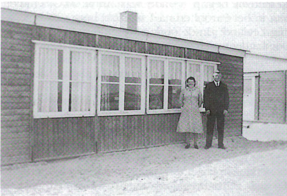
Een eigen woning 'an 't Beyersdiekje'. (Coll. Oud Ouwerkerk in documenten).

Waarschijnlijk was de grootste hulp die men kreeg in het jaar na de ramp een eigen woning, al was het maar een tijdelijke. Uit evacueren bij anderen, hoe moeilijk ook, zijn vaak heel goede relaties ontstaan, soms zelfs tot in de volgende generatie, maar de terugkeer tot zelfstandigheid begint toch echt bij een eigen huis, een eigen bed, tafel en stoelen. Je hoort nog steeds wel zeggen over contacten, ook tussen Ouwerkerkers en Nieuwerkerkers: 'È ja, daer è m'n immers mee an 't Beyersdiekje 'ezete'. Een groot aantal noodwoningen was voor mensen van Nieuwerkerk en Ouwerkerk gebouwd aan de afgegraven westelijke dijk van het poldertje 'Al te klein', gelegen in de hoek tussen de Steenen Dijk en de Oude Polderdijk. Vlak daarbij was de steiger voor de bootjes die naar de dorpen voerden.