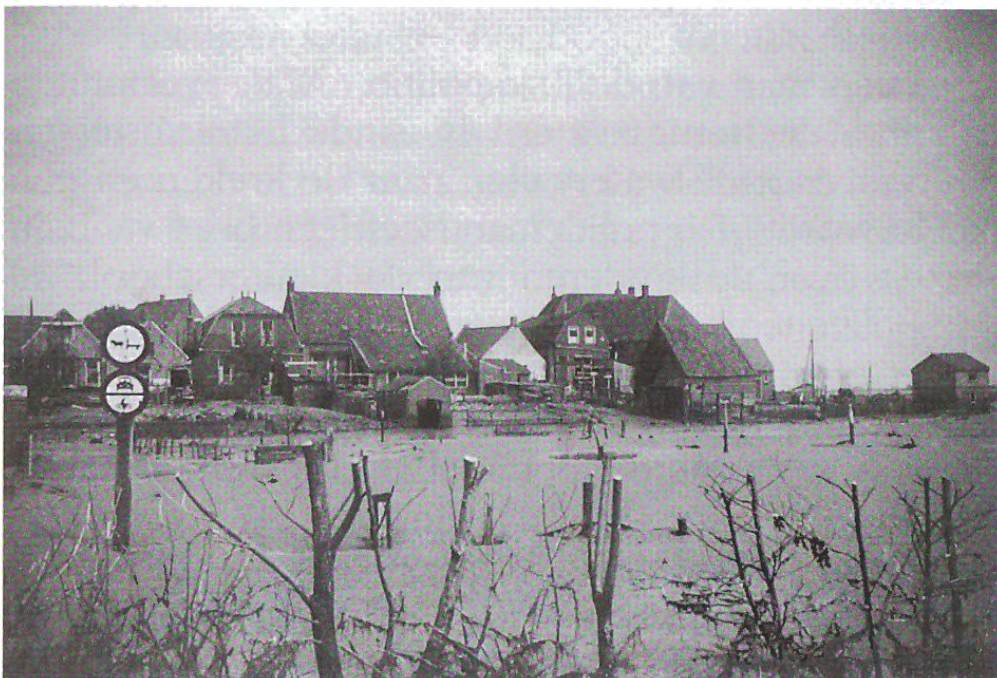
De minst beschadigde zuidoost zijde van het dorp; zelfs het verbodsbord bleef bestaan.

dier, surrealistische vormen, waarop de zeepokken zich hebben vastgezet, nachtmerrieachtige verschijningen met honderd kleine ogen, die gevangen zijn in de ban van een wapperend stuk gordijn'. 'De meeste van de keurige huisjes aan de Ring zijn aan de achterkant vernield of beschadigd, door wrakhout, dat water en wind naar het dorp voerden, waar het als een stormram de huizen, rammeide. Er is geen beter sloopmiddel dan water'.