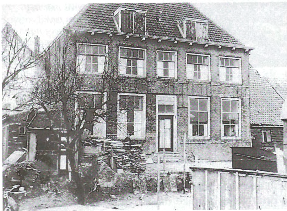
De achterzijde van de bouwvallige pastorie, die 31 januari 1953 werd ontruimd om afgebroken en herbouwd te worden. Het gebouw kreeg een veelzijdige functie: eerst schuilplaats, magazijn onder andere voor lieslaarzen, keuken, aanlegplaats voor vissers uit Yerseke en nu voorlopig onderdak voor vier gezinnen. (Coll. Oud Ouwerkerk in documenten).

In de pastorie werden enkele gezinnen tijdelijk onder gebracht. Noorwegen en Zweden hadden permanente woningen geschonken die geplaatst konden worden zodra de grond bouwrijp gemaakt was.