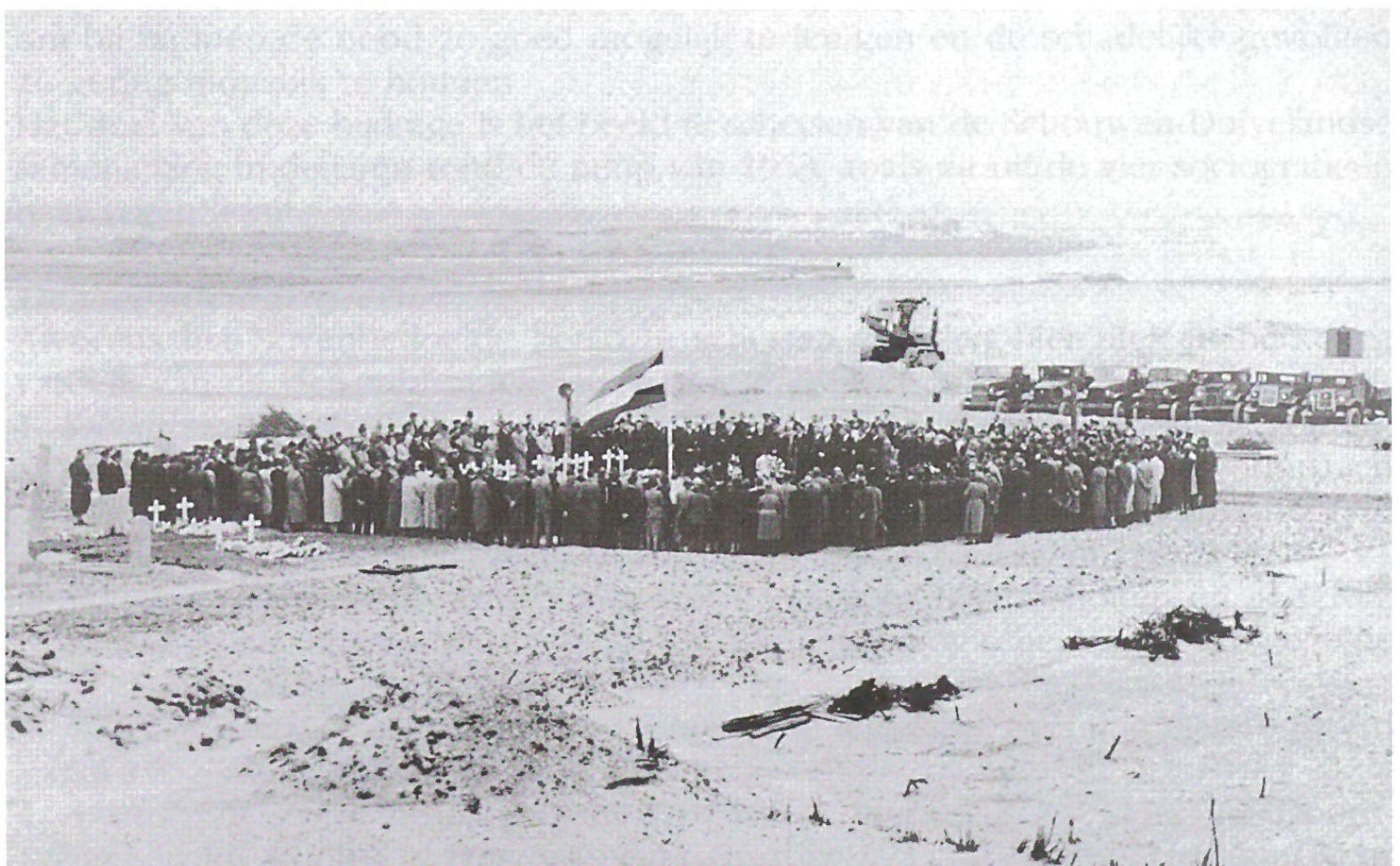
16 Juni 1954. De herbegravenis.

Op 16 juni 1954 vond de officiële herbegravenis plaats, bijna 1½ jaar na de ramp. De werkzaamheden in de polder die nog in volle gang waren, werden tijdelijk gestopt. De vrachtwagens stonden in het gelid; de kranen bogen als eresaluut.