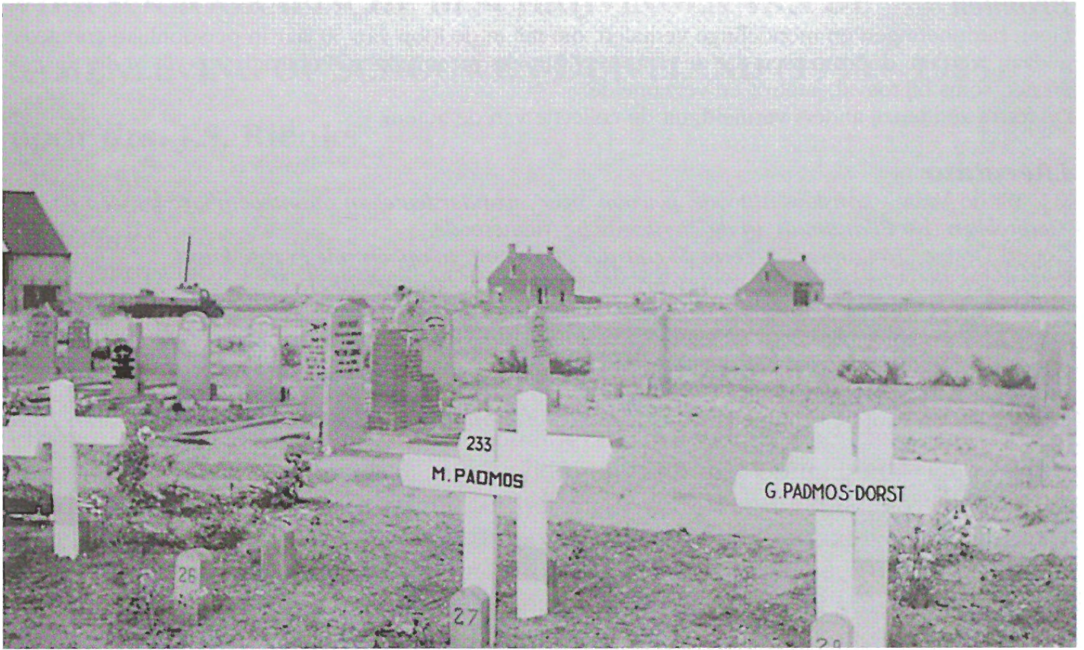
Voorlopig werden de namen op houten kruisen vermeld. (Coll. Oud Ouwerkerk in documenten).

Op 16 juni 1954 vond de officiële herbegravenis plaats, bijna 1½ jaar na de ramp. De werkzaamheden in de polder die nog in volle gang waren, werden tijdelijk gestopt. De vrachtwagens stonden in het gelid; de kranen bogen als eresaluut.