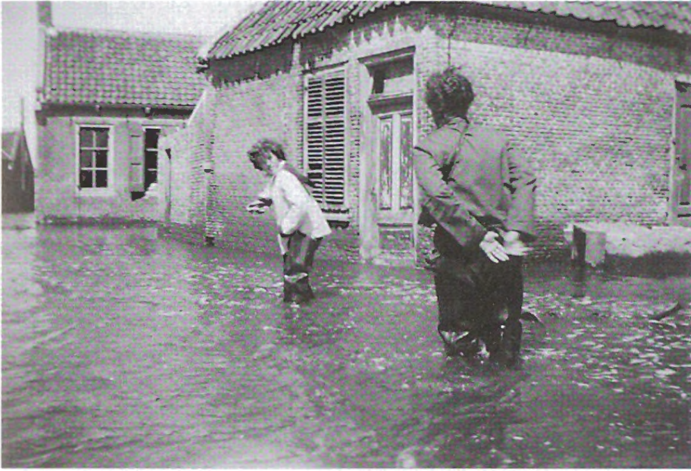
De Lage Weg bij Sirjansland stond op 23 juli nog onder water.

Een internationale hulpploeg was bezig de stinkende troep uit de huizen te halen en die dan met zeewater schoon te boenen. Wat maar enigszins storm en water doorstaan had, werd keurig schoon gemaakt en in de kast gezet. En dat was niet zoveel, maar wel kostbaar, al was het maar een schoteltje. Ze deden belangrijk werk; je eigen rottende inboedel naar buiten smijten met de herinnering aan die laatste nacht nog kersvers in het geheugen is niet om te doen.