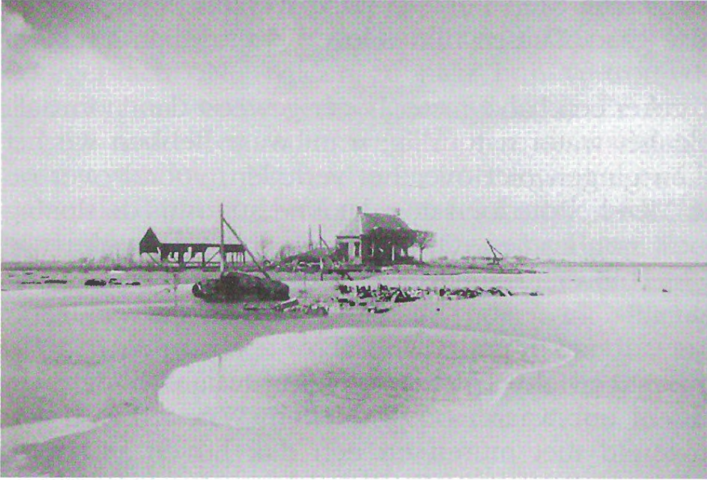
Het restant van boerderij 'Situé Haut', waarvan de bewoners hun vluchtroute naar de leilinden hadden voorbereid. Ervoor de overblijfselen van twee knechtswoningen.

Daar had men vanuit het zolderraam naar de leilinden die er voor stonden een plank gelegd en in die bomen een matras gelegd. Het kon een vluchtroute zijn. Van de meeste woningen in de polder was alleen wat puin over. Van het huis van