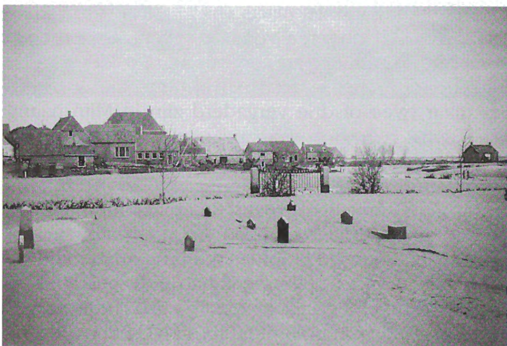
Het kerkhof; de graven begraven onder het zand.

'Over een langgerekte zandplaat komen we bij het kerkhof. Alleen de bovenkant van het toegangshek steekt boven het zand uit'. ...'De zerken zijn onzichtbaar. Alleen de rechtopstaande grafstenen komen er voor een klein deel bovenuit.