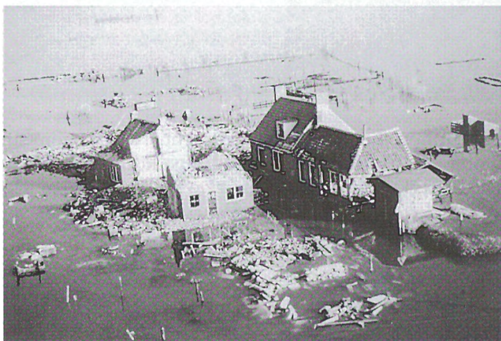
Capelle kort na de ramp. Een jaar later was hier nog maar de helft van over. Rechts erachter de weg naar Ouwerkerk.

Stilzwijgend liet hij de enkele passagiers aan boord komen, gooide de kabel los en zette koers naar Zijpe. Halverwege nam hij de helmstok tussen de benen om de enkele munten overtochtsgeld te innen. Plotseling doemde voor de steven een flinke, losgeraakte ijsschots op uit de koude dampen van de 20ste eeuwse Styx. Het ijzer knarste, het bootje maakte slagzij, maar wat meer gas geven en een flinke ruk aan de helmstok en we kwamen met de schrik vrij'. Deze onzekere reis in de mist was enigszins een voorbereiding op ons reisdoel 'op wat gisteren een vloeibare hel was geweest, de zondvloed waardig'. Vanaf Zijpe gaat een nieuwe bus met hetzelfde kalme gangetje richting Zierikzee. Plotseling stopt hij in 't open veld. De chauffeur roept: 'Capelle', en nodigt ons in onverstaanbaar dialect uit te stappen; maar de andere passagiers spannen zich in ons de weg naar Ouwerkerk te wijzen. 'Daar is het vlakbij, een half uur lopen, rechthuis'.