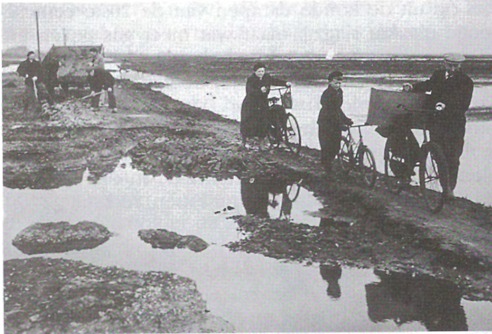
De Molenweg, de enige nog bruikbare toegangsweg is droog, hoewel vol gaten; maar we komen terug.

En ze kwamen terug, in de verwachting dat dat kon op den duur. Zodra de enig overgebleven toegangsweg enigszins begaanbaar gemaakt was kwamen zij, die hun huis in korte tijd bewoonbaar konden maken, terug naar Ouwerkerk. Een vreemd instinct dreef hen terug, vast van plan hun dorp weer op te bouwen.